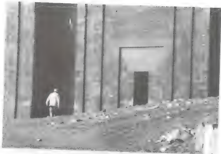
لوير أمام مدخل سور زوسر الذي رممه بنفسه